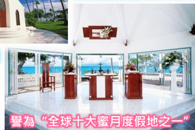
譽為“全球十大蜜月度假地之一”