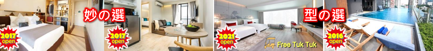
RATCHATHEWI 步行約10分鐘 ON NUT 步行約5分鐘 ASOKE 步行約8分鐘 ASOKE 步行5分鐘

◆ 全程最少兩位成人同行必須共同辦理登機手續及同一航班往返◆ 機位及酒店房間之訂位情況需按報名當天為準, 價格會因不同機位, 出發日期, 同行人數及酒店房間種類等而有差別◆ 圖片僅供參考◆ 價錢及資料如有更改, 恕不另行通知