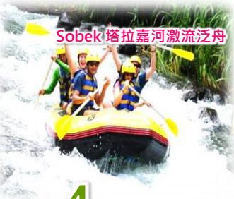
Sobek 塔拉嘉河激流泛舟