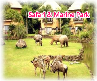
Safari & Marine Park