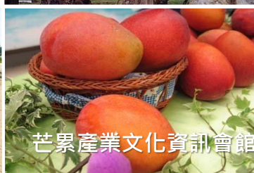
芒累產業文化資訊會館