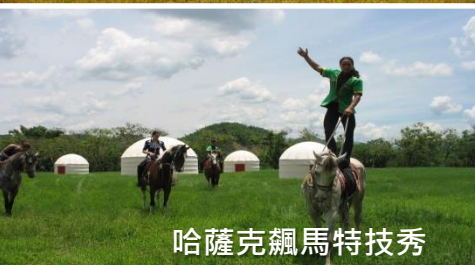
哈薩克騎馬特技秀