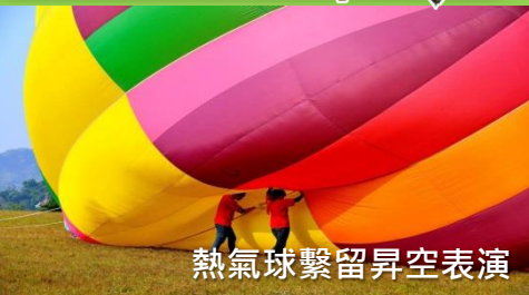
熱氣球繫留昇空表演