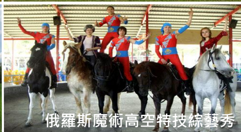
俄羅斯魔術高空特技綜藝秀