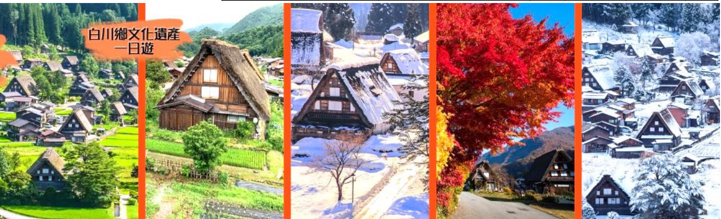
白川鄉文化遺產 一日遊