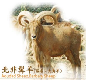
北非髯羊 (俗名: 大角羊) Aoudad Sheep, Barbary Sheep