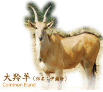
大羚羊 (俗名: 伊蘭羚羊) Common Eland