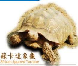
蘇卡達象龜 African Spurred Tortoise