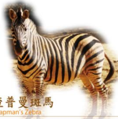
查普曼斑馬 Chapman's Zebra