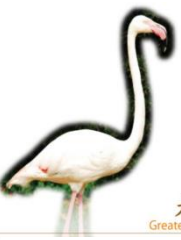
大紅鶴 Greater Flamingo