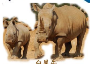
白犀牛 White Rhinoceros, Square-Lipped Rhinoceros