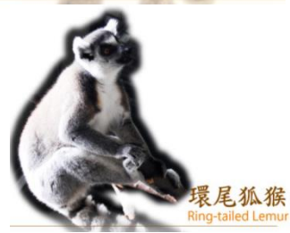
環尾狐猴 Ring-tailed Lemur