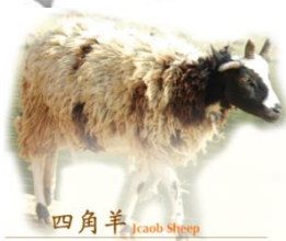
四角羊 Jacob Sheep