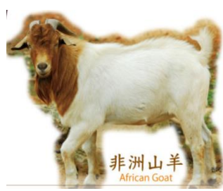
非洲山羊 African Goat